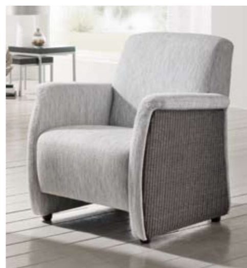
Modell 4121 PEDRO Bezug: 8/Aristano kiesel, Loom antik

Holzfüße werden den Loomfarben angepaßt.