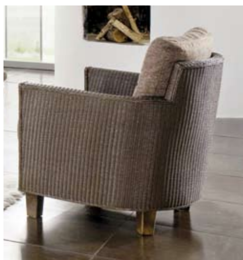
Modell 4120 PABLO Bezug: 6/Laredo schoko, Loom antik

Andere Farben nach Muster gegen Mehrpreis möglich. Aufgrund der wasserlöslichen Lackbasis sind gewisse Abweichungen zur Vorlage in der Regel unvermeidlich. Die Umsetzbarkeit und der Preis muß in einem solchen Fall vorher mit dem Werk abgeklärt werden.