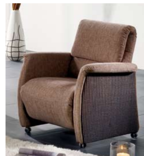
Relaxsessel 149/MAGIC Armlehne C Bezug: 6/Laredo schoko, Loom antik

Eine klappbare Rückenlehne verwandelt diesen Sessel in einen komfortablen Hochlehner. Mit einem einfachen Handgriff lässt sich der Rücken von 88 auf bequeme 118 cm hochklappen.